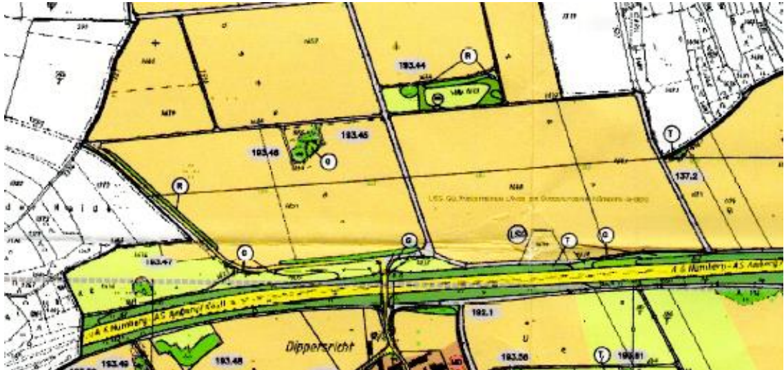
Ausschnitt aus dem wirksamen Flächennutzungsplanes (nicht maßstäblich)

Der Markt Lauterhofen verfügt über einen Flächennutzungsplan mit Landschaftsplan. (wirksam März 2006). Dieser stellt für das Plangebiet Flächen für die Landwirtschaft dar.