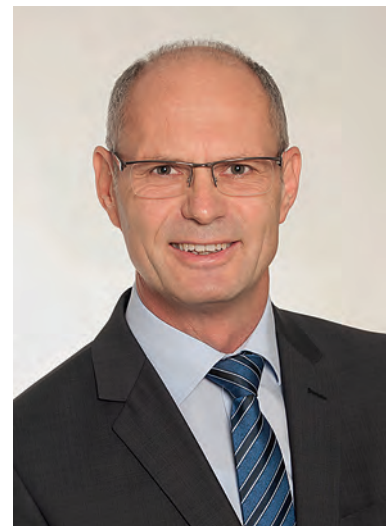
Ludwig Lang Erster Bürgermeister