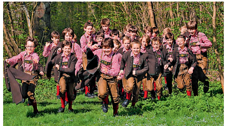
Der Tölzer Knabenchor freut sich auf Lauterhofen!