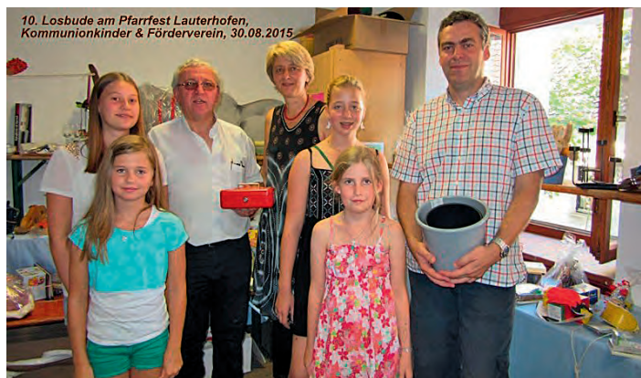
10. Losbude am Pfarrfest Lauterhofen, Kommunionkinder & Förderverein, 30.08.2015