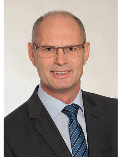
Ludwig Lang Erster Bürgermeister