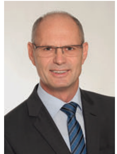
Ludwig Lang Erster Bürgermeister