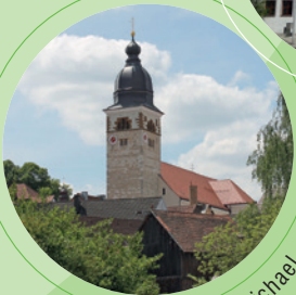
Kirche St. Michael