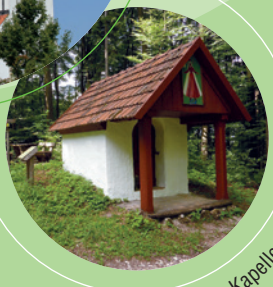
Dietrichstein Kapelle