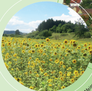
Beim Golfplatz

Bitte beachten Sie, dass der Rufbus nur die Haltestellen anfährt, für die eine Anmeldung vorliegt. Dadurch kann der tatsächlich gefahrene Weg vom Fahrplan abweichen.