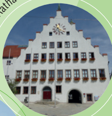
Neumarkt Rathaus