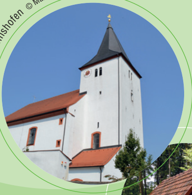
Trautmannshofen © Martina Bauer