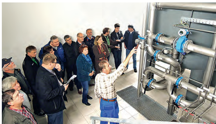
Besichtigung der Aktivkohleanlage im Wasserwerk Birgland.

Das Versorgungsnetz des Zweckverbandes der Pettenhofener Gruppe umfasst 118 Kilometer womit über 4000 Anschlüsse in fünf Gemeinden – Lauterhofen, Kastl, Alfeld, Pilsach und Berg - versorgt werden. Die Jahresabnahmemenge beträgt rund 350.000 Kubikmeter. Die Quellschüttung am Hallerbrunnen ergibt maximal 120 Liter in der Sekunde, derzeit aber beträgt die Schüttung nur 45 Liter in der Sekunde, wie der Wassermeister unterrichtete