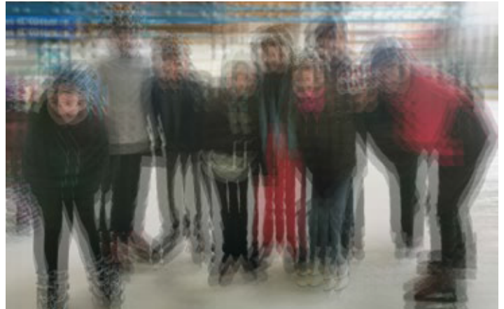
Unsere Gäste beim Eislaufen