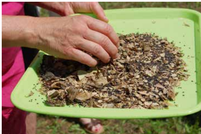
2023_Februar_Bild 01_Samenernte: Wer eigenes Saatgut ernten möchte, braucht etwas Geduld, aber es lohnt sich! Um dauerhaft gute Erfolge beim Nachziehen zu erlangen, sollte darauf geachtet werden „samenfestes“ Saatgut zu beziehen.

Wer Obstgehölze im Frühjahr veredeln möchte, sollte jetzt die Edelreiser schneiden . Darunter versteht man gesunde, kräftige einjährige Triebe von ausgewählten Sorten. Die Reiser werden etikettiert und am besten an einem schattigen Platz im Garten komplett eingegraben. Dort ist es dunkel, kalt und feucht, also ideal zur Aufbewahrung bis zum April, wo dann die Veredelungen vorgenommen werden.