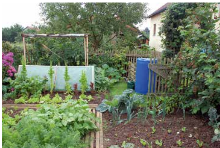
2023_Februar_Bild 02_Anbauplan im Garten: Eine gute Planung des Gemüsebeetes im Vorfeld trägt zu einem gesunden Wachstum der Kulturen bei.