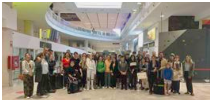
Herzlicher Empfang der Reisegruppe am Flughafen in Arrecife

Am ersten Tag nach der Ankunft hatten die Schüler/innen die Gelegenheit, einen Tag mit ihren Austauschschülern und Gastfamilien zu verbringen. Viele nutzten die Gelegenheit, um unter anderem auf Kamelen zu reiten, Se-