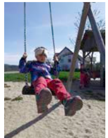
Die faszinierende Welt der Erde: Eine Reise zum Verständnis und Genuss der Natur