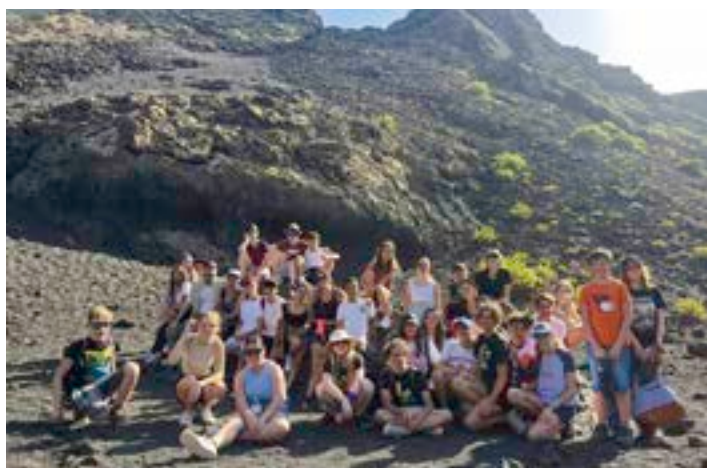
Gruppenfoto im Krater eines inaktiven Vulkans

Am dritten Tag besuchten die Schüler/innen die „Jameos del Agua“, eine Vulkangrotte, bei der es verschiedene Sehenswürdigkeiten zu betrachten gab, darunter ein unterir-