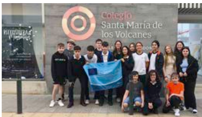
Die SchülerInnen und ihre Austauschschüler vor dem Colegio Santa Maria