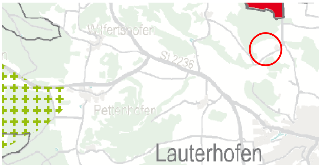
Planausschnitt aus der Karte 3 „Landschaft und Erholung“ (roter Kringel)

Im Regionalplan sind keine Darstellungen getroffen, die der Planung entgegenstehen.