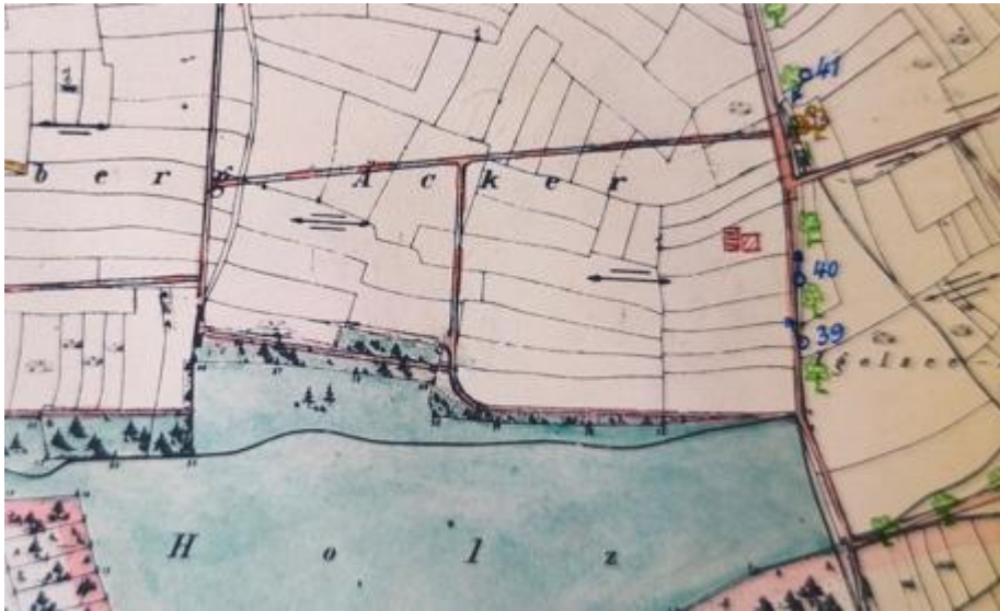
Ausschnitt aus der Landschaftskarte zur Flurbereinigung Deinschwang (20.12.1963)

Das Plangebiet liegt im Bereich des Flurbereinigungsverfahrens Deinschwang (1963). Laut den Planunterlagen ist im Geltungsbereich ein Flurweg vorgesehen. Gemäß der aktuellen Flurkarte ist der Weg jedoch nicht umgesetzt und es handelt sich beim Geltungsbereich um ein zusammenhängendes Flurstück. Auf den Nachbargrundstücken sind keine Maßnahmen vorgesehen, die durch die Planung berührt werden.