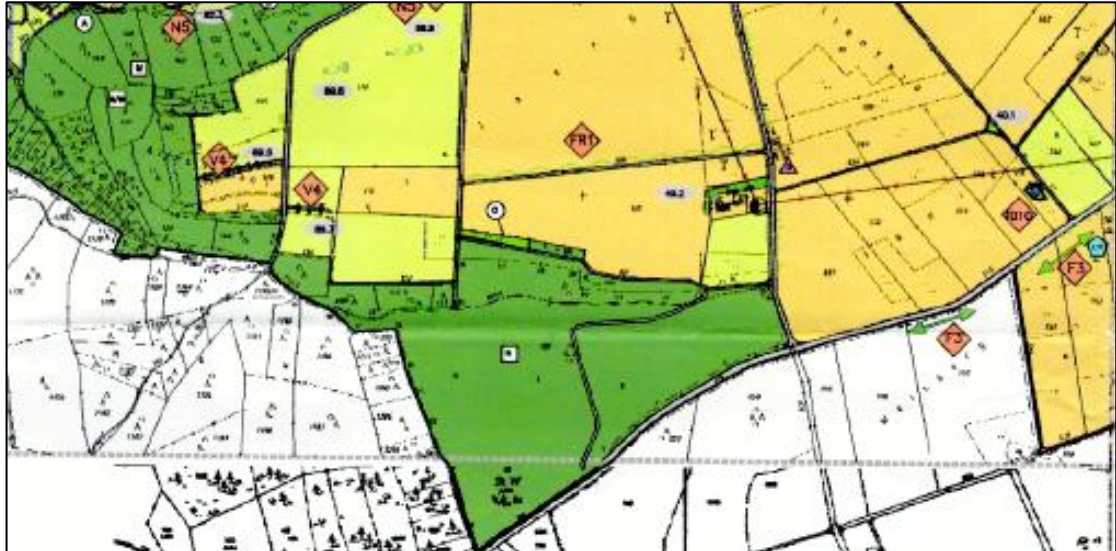
Ausschnitt aus dem wirksamen Flächennutzungsplanes (nicht maßstäblich)

Der Markt Lauterhofen verfügt über einen Flächennutzungsplan mit Landschaftsplan. (wirksam März 2006). Dieser stellt für das Plangebiet Flächen für die Landwirtschaft dar.