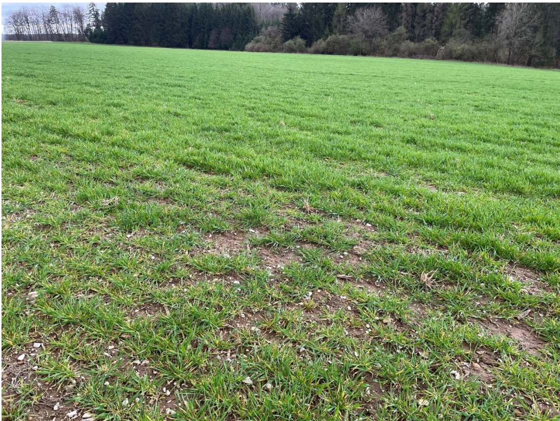
Abb. 3: Ansicht des Geltungsbereichs