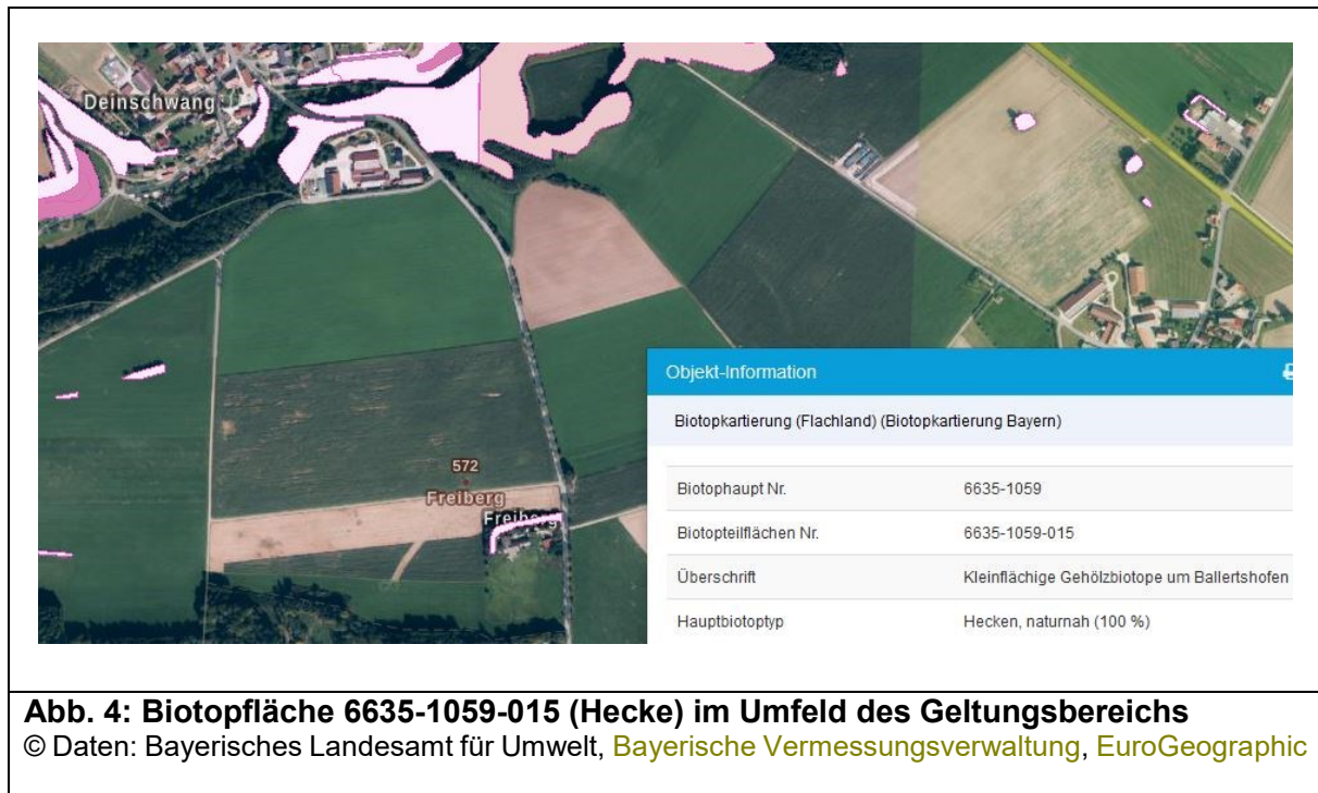
Abb. 4: Biotopfläche 6635-1059-015 (Hecke) im Umfeld des Geltungsbereichs