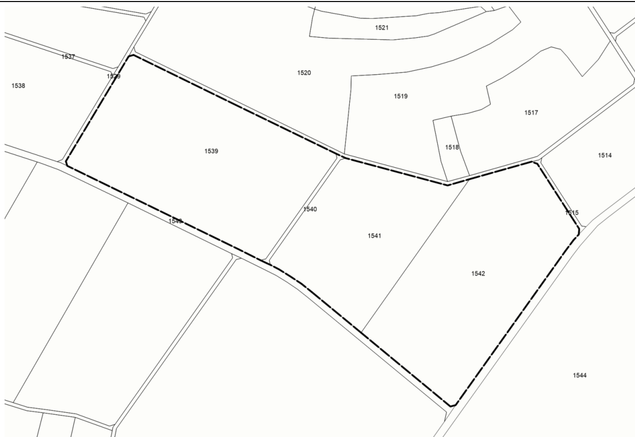
Abb. Geltungsbereich nicht maßstäblich

Ziel der Planung ist die Errichtung eines Solarparks. Mit der geplanten Photovoltaikfreiflächenanlage kann das Ziel von Bund und Land unterstützt werden, den Anteil der erneuerbaren Energien bei der zukünftigen Energiebereitstellung deutlich auszubauen und hierdurch den CO 2 -Ausstoß zu verringern. Die Errichtung und der Betrieb von Anlagen zur Produktion elektrischer Energie liegen im überragenden öffentlichen Interesse und der öffentlichen Sicherheit (§ 2 EEG).