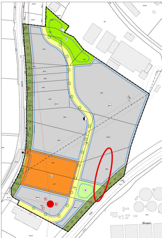
Abb.: Ausschnitt Bebauungsplan „Gewerbepark Lauterhofen Süd I“ mit Änderungsbereich roter Krinkel (2023 Markt Lauterhofen)

Der Bebauungsplan „Gewerbepark Lauterhofen Süd I“ der Markt Lauterhofen trat im Jahr 2023 in Kraft.